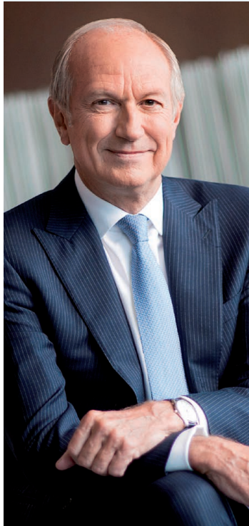
Jean-Paul Agon L'Oréal CEO & Chairman zum Thema Nachhaltigkeit