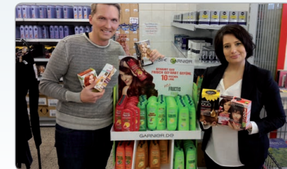
Partnerschaft mit Sozialmarkt Wien

Produktspenden an Hilfsorganisationen z.B. Caritas