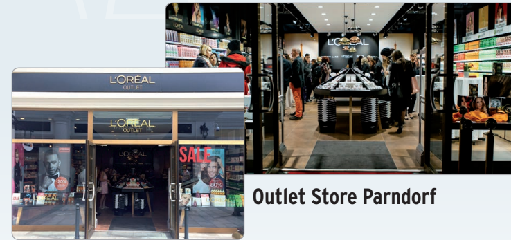
Outlet Store Parndorf

Produkte neuen Zielgruppen zugänglich machen